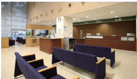
待合室やロビーなど院内の不審者監視