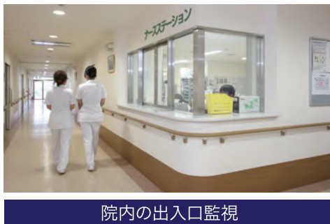
院内の出入口監視