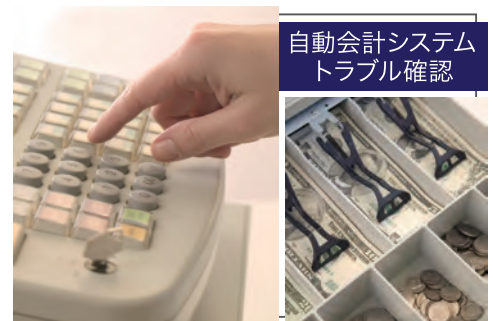
自動会計システム トラブル確認